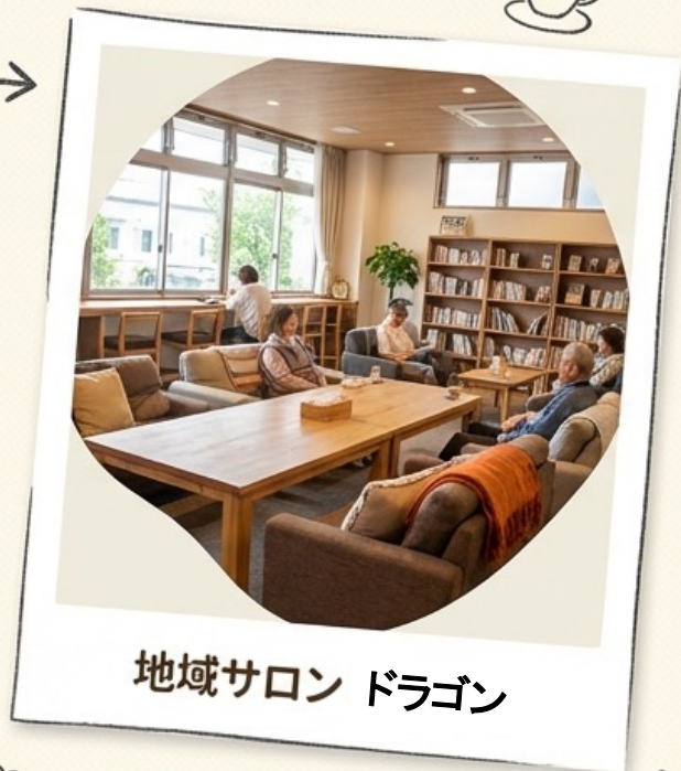
地域サロン ドラゴン