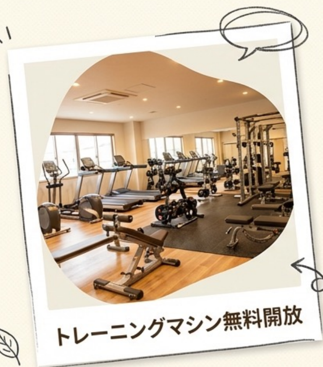
トレーニングマシン無料開放